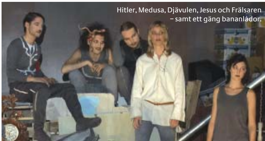
Hitler, Medusa, Djävulen, Jesus och Frälsaren – samt ett gäng bananlådor.