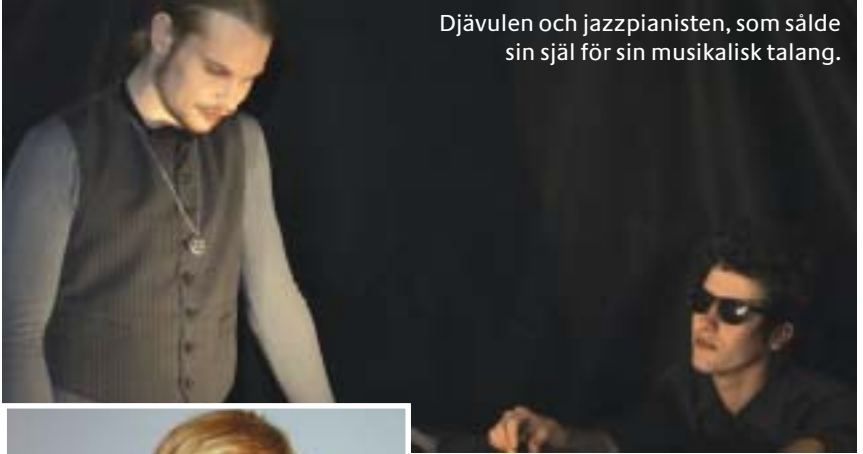
Djävulen och jazzpianisten, som sålde sin själ för sin musikalisk talang.